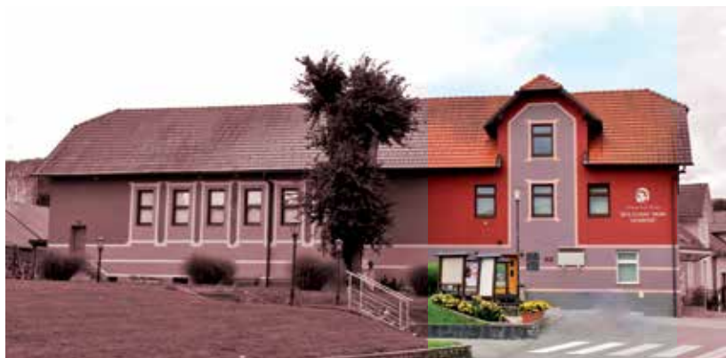
Slika 1: Spominska plošča na zidu Kulturnega doma v Dobrniču