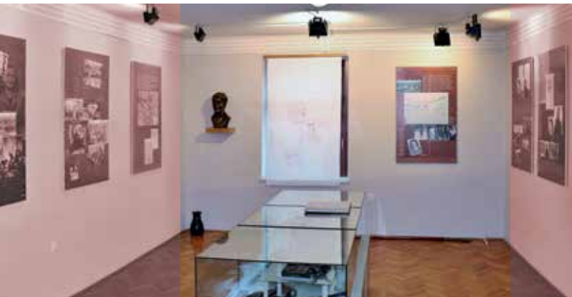
Slika 2: Spominska soba prvega kongresa SPŽŽ

Dokumenti, gradivo in osebni predmeti udeleženk kongresa so shranjeni v spominski sobi prvega kongresa, ki se nahaja v prvem nadstropju kulturnega doma. Gradivo je pred leti strokovno uredil Muzej novejše zgodovine. Na vrhnjem obrobju sten pod stropom spominske sobe so izpisana imena vseh delegatk prvega kongresa (slika 2).