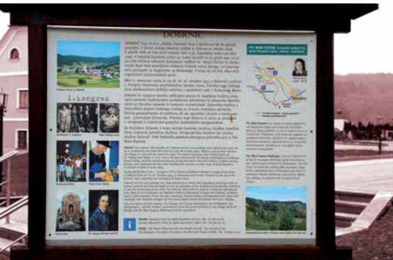
Slika 4: Informativna tabla v središču Dobričnika

množično udeležbo pa je potekal ob 60. obletnici ustanovnega kongresa (2003). Uresničitev zamisli za pohod in njegovo vključitev v Evropsko pešpot je bila mogoča ob učinkovitem sodelovanju Kulturno-turističnega društva v Dobričniku in Zavoda RS za gozdove (območna enota v Novem mestu).